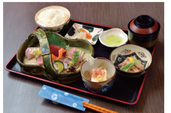
おすすめはもちろんお刺身。その日のおすすめを盛り合わせた「刺身定食」(980円)は小鉢、漬物、味噌汁、ご飯付き。